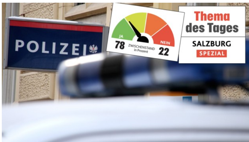
Blitz-Umfrage: Brauchen wir mehr Polizisten auf den Straßen?